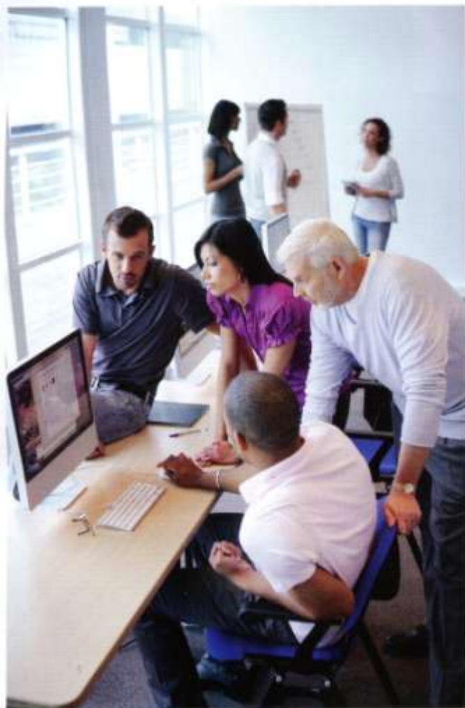
Une difficulté pour les PME : élargir leur responsabilité au-delà de leur propre activité.

Viac : « Cela demande d'être à l'écoute du marché. Les clients et les partenaires ont de nouvelles attentes. Il faut pouvoir y répondre non seulement en termes d'impact sur l'environnement mais également en termes de bonnes pratiques vis-à-vis de